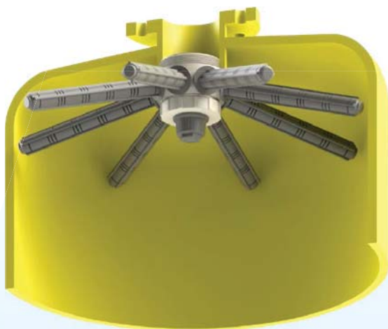
FILTER ARM SD