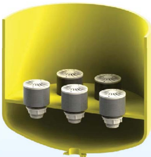
NOZZLE D9 - 15D - ID35